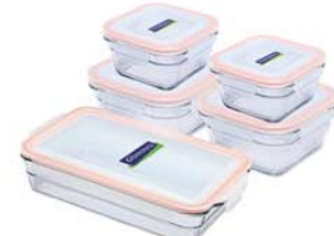
GL - 342 (OCST040, 090, OCRT048, 090, OCRP220)