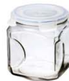
IP - 591 1500ml (125x125x142mmH)