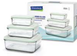
GL - 54 (RP519, RP533, RP532)