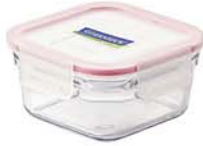
ORST - 113 1130 ml (153x153x72 mmH)