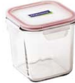
MCSD - 092 RP 530 / 900 ml (115x115x114 mmH)