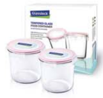
GL - 314 ( RP529 X 2 )