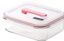
MHRB - 270 RP 603 / 2700 ml (220x190x95 mmH)