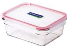
OCRT - 173A 1730 ml (208x162x79 mm)