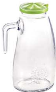
IJ 931 1700ml