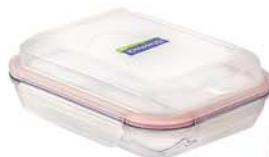
MPRB - 090 900 ml (210x195x44 mmH)