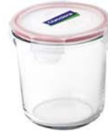
MCCD - 072 RP 529 / 720 ml (115x114 mmH)