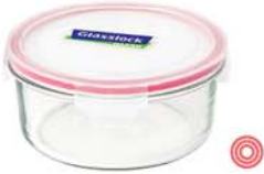
MCCB - 095 RP 536 / 950 ml (160x69 mmH)