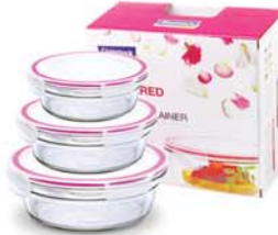
GL - 531 OCCT SET (OCCT045, 085, 148)