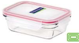
OCRT - 090 970 ml (177x131x68 mm)