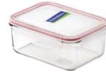
MCRB - 110 RP 518 / 1100 ml (177x131x68 mmH)