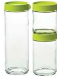
IG - 588 IP607 . IP608 . IP609