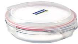
OCCT - 170 1700ml (280x52.5 mmH)