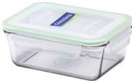
MCRT - 170 RP 711 / 1700 ml (211x148x87 mmH)