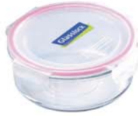
MCCB - 072 RP 524 / 720 ml (148x57 mmH)