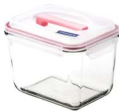
MHRB - 250 RP 602 / 2500 ml (200x150x135 mmH)