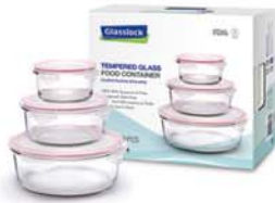
GL - 56 (RP525, RP536, RP537)