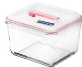
MHRB - 370 RP 604 / 3700 ml (220x190x135 mmH)