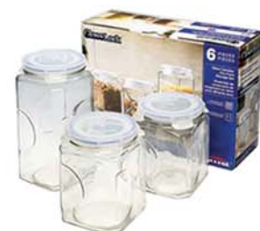
IG - 535 (IP 591. IP 592. IP 593)