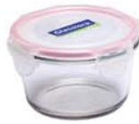
MCCT - 041 RP 752 / 410 ml (114x68 mmH)