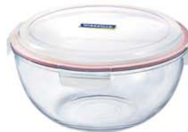
MCBC - 400 4000ml (260x120 mmH)