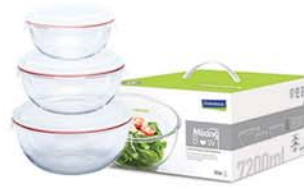
MCBC SET (MCBC 100, 200, 400)