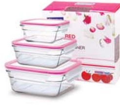
GL - 530 OCST SET (OCST040, 090, 165)