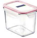
MCRB - 102 RP 528 / 1025 ml (148x99x114 mmH)