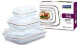
GL - 507 (RP035D, 090D, 190D)