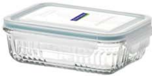
OCRS - 360 3600 ml (291x231x76 mmH)