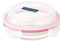
MPCB - 080 RP 803 D / 800 ml (210x39 mmH)