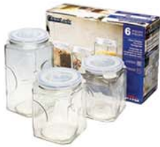
IG - 535 ( RP591, RP592, RP593 )