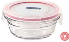
OCCT - 148 1480 ml (190x79 mm)