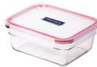
OCRT - 090A 970 ml (177x131x68 mm)