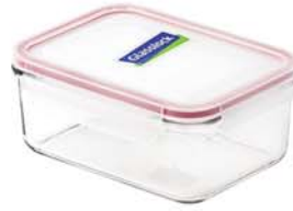
MCRB - 190 RP 517 / 1900 ml (210x147x87 mmH)