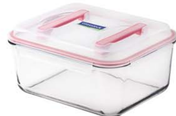
MHRB - 600 RP 551 / 6000 ml (290x230x130 mmH)