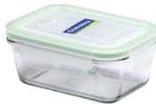
MCRT - 098 RP 712 / 980 ml (177x131x68 mmH)