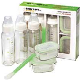
IG 312 ( RP520 X2 . Bottles X3 . Spoon X1 )