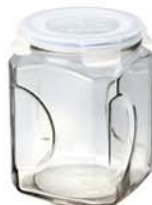
IP - 592 2000ml (125x125x182mmH)