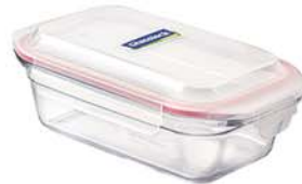
OCRT - 175 1750ml (286x150x75.5 mm)