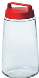
IP - 624 5000ml (172x295mmH)