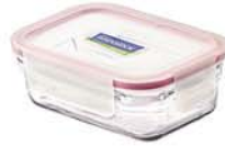
ORRT - 102 1020 ml (172x125x72 mmH)