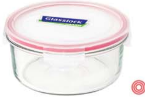
MCCB - 205 RP 537 / 2050 ml (211x81 mmH)