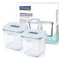
GL - 81 ( RP530 X 2 )