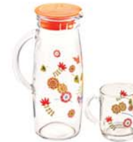
IG - 643 ( IJ922, IG641 x6 )