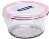
MCCT - 073 RP 751 / 730 ml (146x68 mmH)