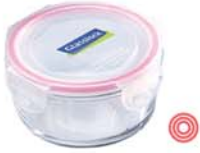
MCCB - 040 RP 525 / 400 ml (115x57 mmH)