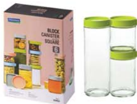
IG - 588 ( IP607, IP608, IP609 )