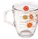
PM 437 375ml