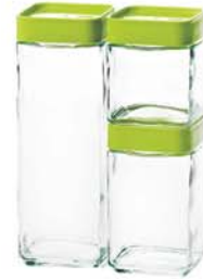
IG - 589 IP604 . IP605 . IP606