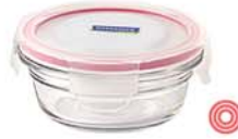
OCCT - 085 855 ml (160x68 mm)