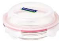
MPCB - 035 RP 802 D / 350 ml (160x32 mmH)