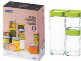
IG - 589 ( IP604, IP605, RP606 )