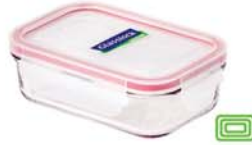
MCRB - 100 RP 533 / 1090 ml (190x141x55 mmH)