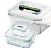
PICNIC (RP601, RP521, RP559-1)