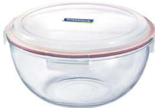
MCBC - 600 6000ml (299x138 mmH)