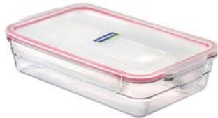
OCRP - 220 2200ml (308x185x62 mm)