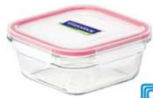
OCST - 090 900 ml (140x148x68 mm)