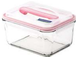
MHRB - 180 RP 601 / 1800 ml (200x150x95 mmH)