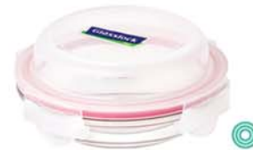
MPCB - 175 RP 804 D / 1750 ml (270x50 mmH)