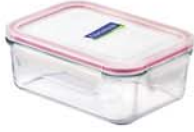
MCRB - 071 RP 521 / 715 ml (164x115x57 mmH)