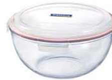
MCBC - 200 2000ml (213x99 mmH)