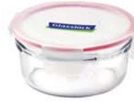
ORCT - 090 900 ml (153x72 mmH)