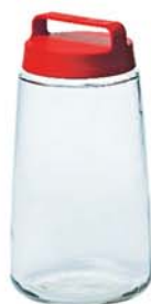
IP - 623 4000ml (162x280mmH)