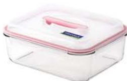
MHRB - 200 RP 608 / 2000 ml (231x182x67 mmH)