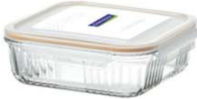
OCSS - 190 1900 ml (211x211x64 mmH)