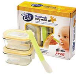
IG 268 ( RP520 X2 . Spoon X1 )