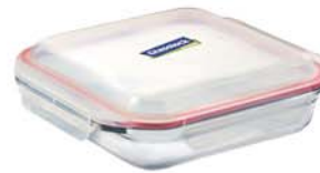
OCST - 210 2100ml (281x1281x48.5 mm)