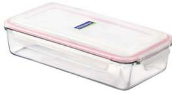
MCRP - 170 RP 607 / 1700 ml (300x147x57 mmH)