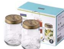
IG - 754 ( IP627H x2 )