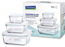
GL - 55 (RP523, RP534, RP535)