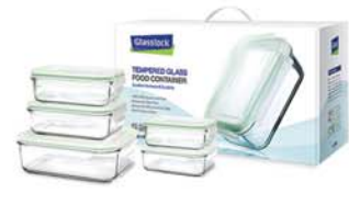
GL - 08 (RP517, RP519X2, RP518X2)