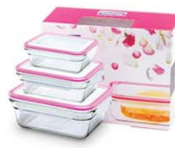
GL - 529 OCRT SET (OCRT048, 090, 173)