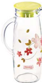
IJ 922 1000ml