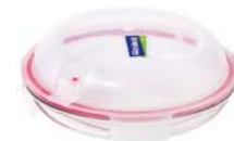
MPCB - 08A RP 802A / 800 ml (210x39 mmH)