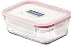
ORRT - 178 1780 ml (205x142x91 mmH)