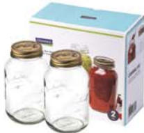
IG - 752 ( IP627 x2 )