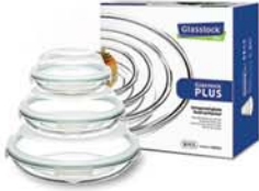
GL - 350 (RP802D, 803D, 804D)