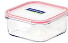
MCSB - 260 RP 535 / 2600 ml (211x211x81 mmH)