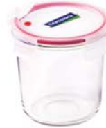
MCCD - 072A RP 529A / 720 ml (115x114 mmH)