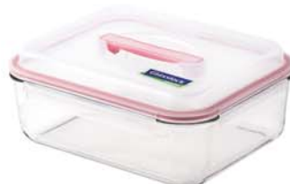
MHRB - 450 RP 605 / 4500 ml (290x230x95 mmH)