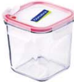
MCSD - 092A RP 530A / 900 ml (115x115x114 mmH)