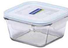
MCST - 092 RP 731 / 920 ml (148x148x68 mmH)