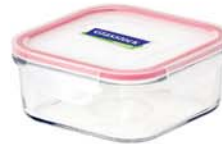
MCSB - 120 RP 534 / 1200 ml (160x160x69 mmH)