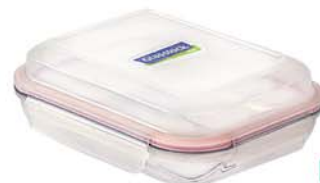
MPRB - 190 1900 ml (288x210x55 mmH)