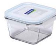
MCST - 050 RP 732 / 500 ml (115x115x68 mmH)