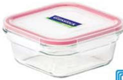
OCST - 165 1650 ml (180x180x79 mm)