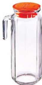
IJ 902 1090ml