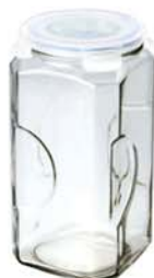
IP - 593 3000ml (125x125x262mmH)