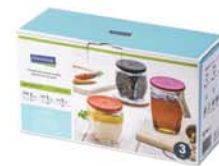
IG - 674 ( IP508, IP510, RP531 )