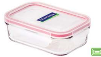
MCRB - 200 RP 532 / 2000 ml (231x182x67 mmH)