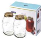
IG - 751 ( RP626 x2 )