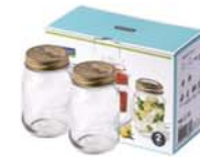
IG - 753 ( IP626H x2 )