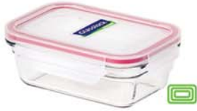
OCRT - 173 1730 ml (208x162x79 mm)